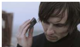
I came from the future Dave Lojek Cinema Germania e Polonia 4'

Equinox si ispira al concetto dei due volti: il volto che mostri al mondo e il volto di chi sei veramente.