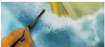
The artist Nazar Germanov Animazione Inghilterra 8'

Un'esplorazione, attraverso la poesia e il movimento, della sessualità femminile come espressione della natura stessa.