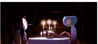
The n.a.p. Adolfo Di Molfetta Animazione Italia 8'

Sii orgoglioso del tuo lavoro e sarai rispettato. Non pensare mai di essere più importante di altri. Fai attenzione al tuo dovere. La negligenza può farti perdere la tua posizione. Quindi cura ogni tuo passo.