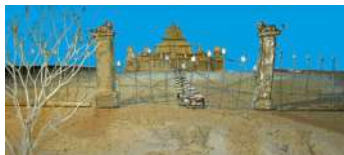
President's House Allabhya Ghosh Fumetto India 7' 44"

Da bambino Eugene è stato affascinato da un dipinto. Crescendo è diventato un artista. Eugene ha deciso di dipingere quel quadro, la cui immagine è rimasta indelebilmente impressa nella sua memoria.