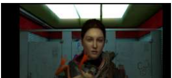
Uncanny theory Luiz Fernando Rohenkohl Animazione Brasile 2'

Una sensazionale avventura cartoon ci catapulta in un mondo immaginario, abitato da personaggi eccentrici e fantastici, dove ogni sorta di fenomeno inspiegabile sembra invece possibile. In questo caotico universo, dove la realtà lascia spazio all'immaginazione più fervida e lo straordinario diventa improvvisamente ordinario, il paradosso regna sovrano.