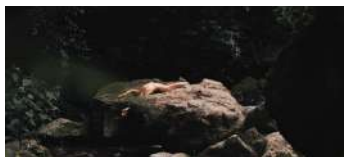
Sacred house of pleasure Gonzalo Romero Danza Messico 3'42"

Su di un tetto, un pensieroso uomo d'affari, legge il suo biglietto d'addio e riflette.