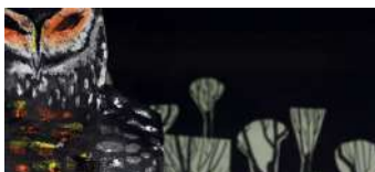
El Mago Georges Katalin Egely Animazione Ungheria 4'