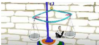
Election Allabhya Ghosh Fumetto India 4' 30"

Il film segue un attore-ballerino attraverso la difficile scoperta di sé, sperimentando sia la censura altrui che quella autoimposta.