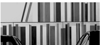
Protected Sleep Luc Gobyn Pittura/Architettura Belgio 8'40"

"A Dance for A" è stato girato utilizzando due iPhone, treppiedi, software di editing e illuminazione regolabile, ascoltando "Winter Solstice" di Richard Shulman. Il lavoro si concentra sui movimenti e sui gesti della parte superiore del corpo per trasmettere l'intensa irrequietezza dei giorni di pandemia.