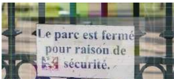
Com-Vida 20 Ana Cavazzana Televisione Portogallo 2' 45''