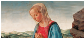
Invito a Palazzo Creberg I DIPINTI Credito Bergamasco Banco BPM 34'

Trentaquattro minuti intensi con suggestive immagini di opere appartenenti alla "Collezione Creberg", ora parte del Patrimonio Artistico di Banco BPM; un racconto avvincente, accompagnato da musiche evocative di grandi autori classici. Un percorso virtuale all'interno del Palazzo Storico Creberg, che apre le porte alla visione delle sue principali opere d'arte.