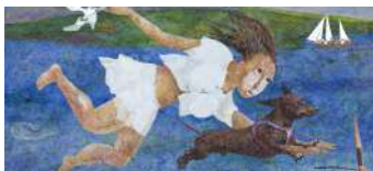
The Dachshund in a Picture Tatiana Skorklupkina Pittura Russia 9'40''