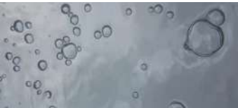
Aman Iman Mustapha Benghernaout Cinema-Musica Algeria 2' 05"

È il giorno libero di Assaf, ma la moglie lo trascina al museo. Nel corso della visita, in un luogo che non cambia mai, Assaf riflette sul cambiamento che è avvenuto in loro nel corso del tempo.