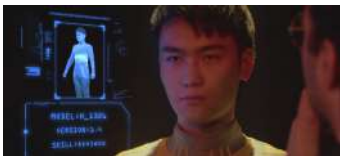
The Creator Sergiy Pudich Cinema Ucraina | Cina 5'