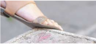
Fainting Flicker Dave Loiek Danza Germania/Italia 4' 30"

Due giovani sconosciuti si incontrano a Napoli e cominciano a flirtare e ballare per strada.